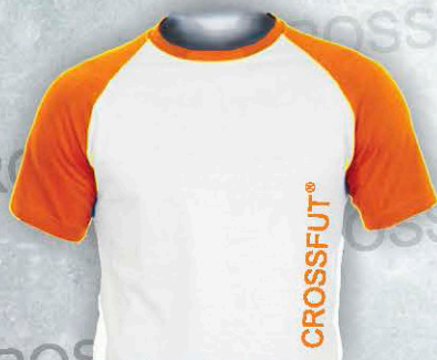
Mod. PH 2050 T. CH/M/G/XL Color. Blanca (3/4 Naranja)