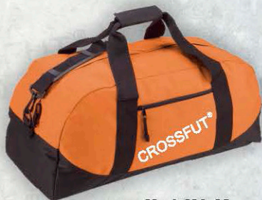
Mod. MA-32 Color. Naranja