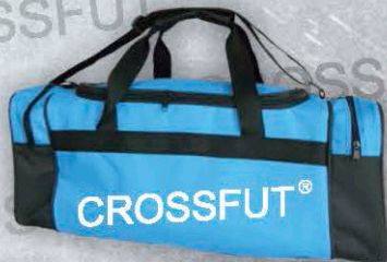
Mod. MA-26 Color. Azul