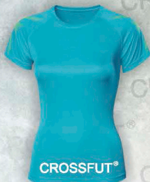
Mod. PM 2520 T. CH/M/G Color. Azul Med.