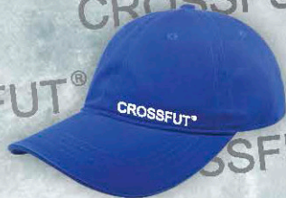
Mod. GOR 262 Color. Azul