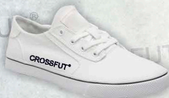
Mod. TN 018 T. 22 - 26 Color. Blancos