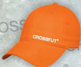
Mod. GOR 254 Color. Naranja