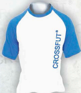
Mod. PM 2520 T. CH/M/G Color. Blanca (3/4 Azul)