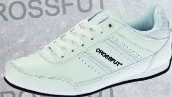
Mod. TN 015 T. 23 - 27.5 Color. Blancos