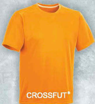
Mod. PH 2050 T. CH/M/G/XL Color. Naranja